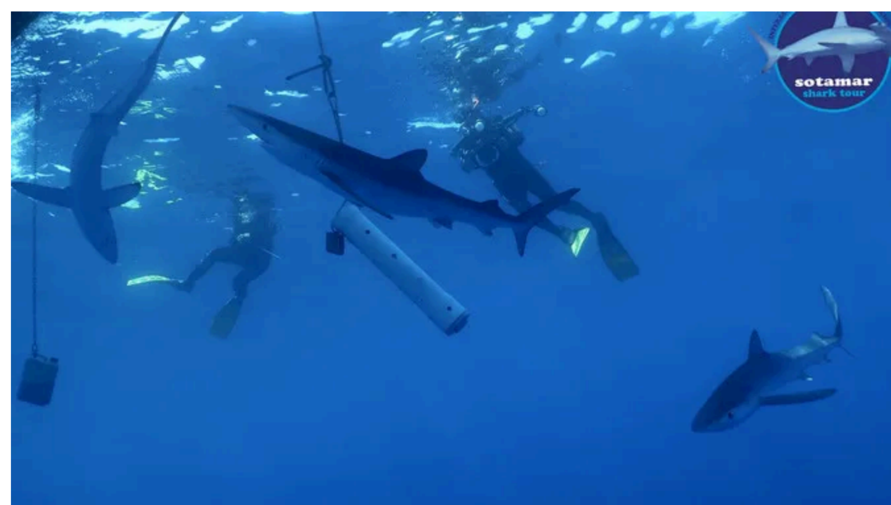
Tres tintorerer captades pel centre d'immersió Sotamar a la zona del canó del cap de Creus (ACN Jordi Riera-Sotamar)

Entre finals de primavera i mitjans d'agost, s'hi han observat uns 90 exemplars, deu dels quals són cries d'entre 35 i 45 centímetres. Els investigadors creuen que aquest és un lloc propici per a les tintorerer.