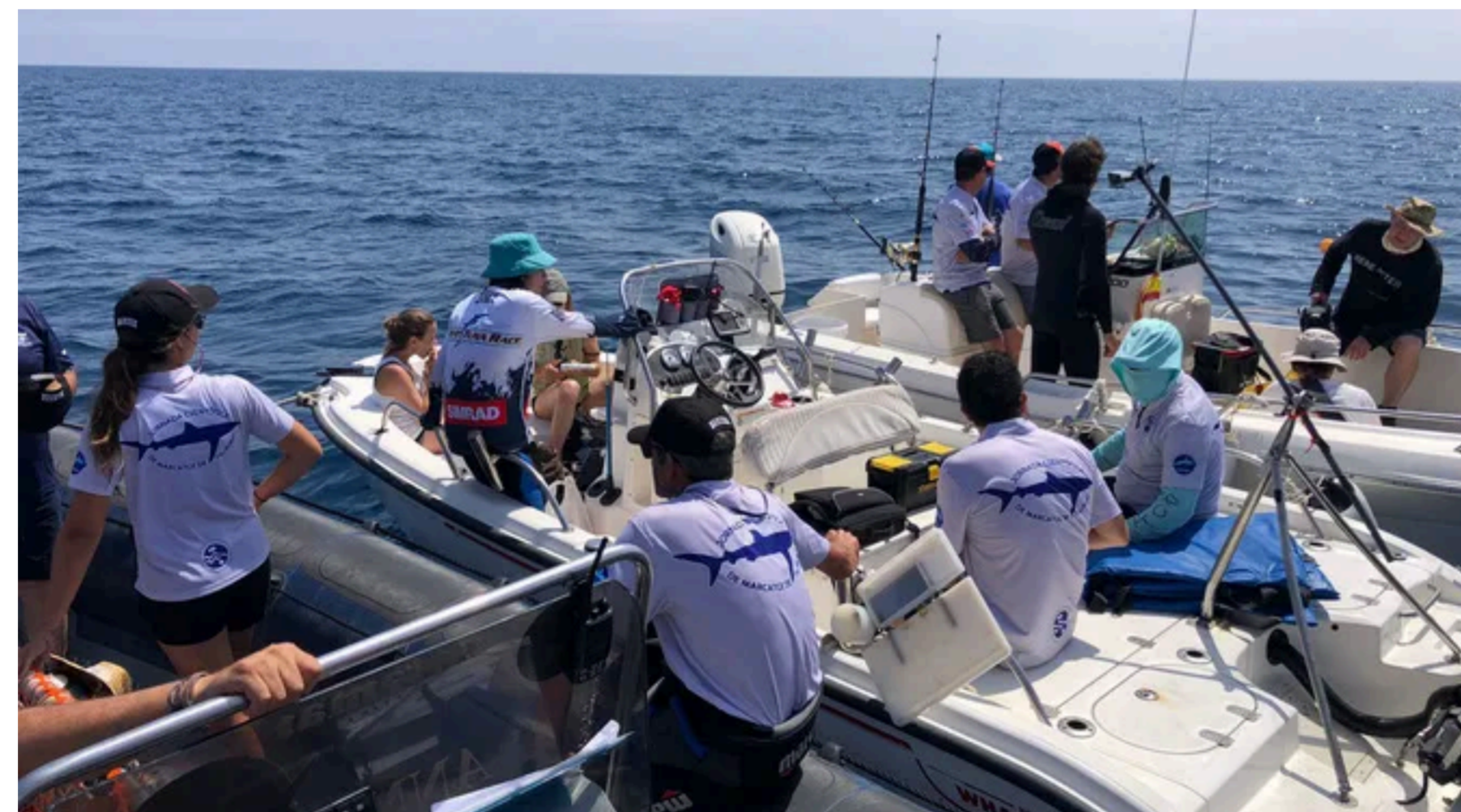
Equips que han participat en el marcatge de les tintorerer