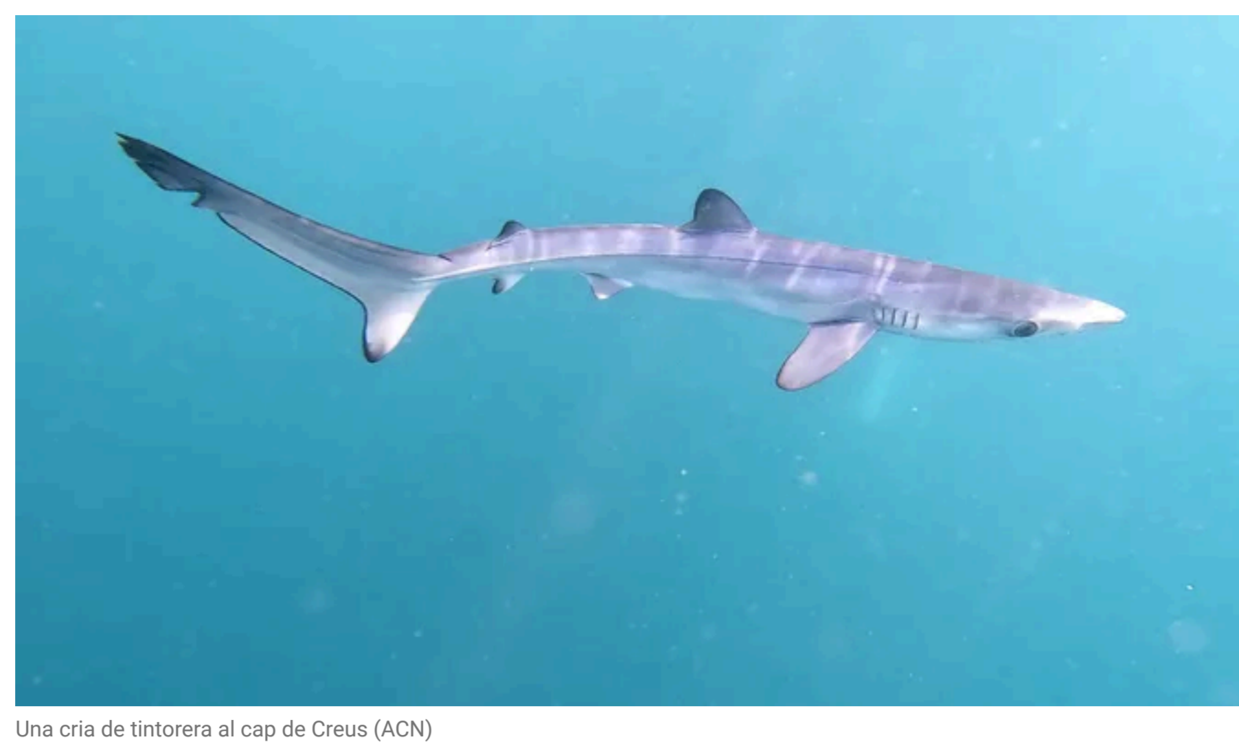
Una cria de tintorera al cap de Creus

El cap de Creus és un dels únics indrets de la Mediterrània occidental on es reproduïxen les tintorerer, una espècie en perill d'extinció.